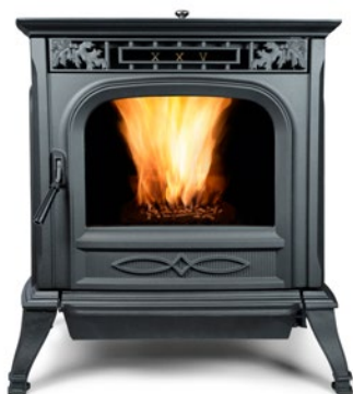
FRONTE GRIS ANTHRACITE