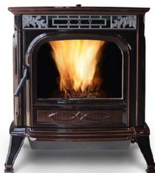
FRONTE ÉMAILLÉE MAJOLICA