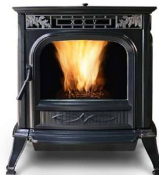
FRONTE ÉMAILLÉE TWILIGHT

Le modèle HARMAN XXV est sans aucun doute un des appareils les plus remarquables avec un impact visuel garanti. Son ensemble en fonte surélevé par des pieds lui donne une force de caractère imposante.