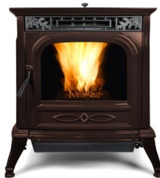
FONTE ÉMAILLÉE MAJOLICA

Le modèle HARMAN XXV est sans aucun doute un des appareils les plus remarquables avec un impact visuel garanti. Son ensemble en fonte surélevé par des pieds lui donne une force de caractère imposante.