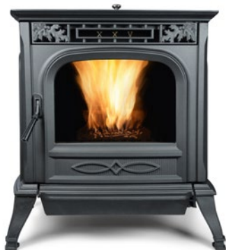
FONTE GRIS ANTHRACITE

Le modèle HARMAN XXV est sans aucun doute un des appareils les plus remarquables avec un impact visuel garanti. Son ensemble en fonte surélevé par des pieds lui donne une force de caractère imposante.