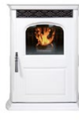
gris clair frost