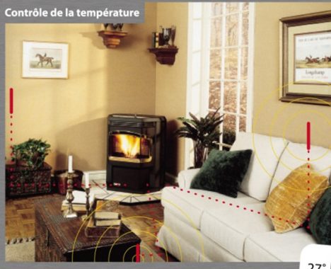
Contrôle de la température

Le secret de l'Advance réside dans sa fine capacité de régulation. Assez précis pour être installé n'importe où dans la pièce, un minuscule capteur directement relié au microprocesseur de l'Advance permet d'assurer le maintien d'une température constante sans connaître les variations rencontrées avec les autres poêles à granulés.